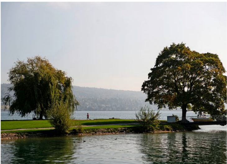
Für die Ausstellung für Frauenarbeit im Jahr 1958 wurde eigens eine kleine Insel vor der Landiwiese aufgeschüttet.

Der Umzug, an dem rund 100 Gruppen mit 2000 Personen von Pfadfinderinnen über Aviatikerinnen und Arbeiterinnen bis zu Trachtenfrauen teilnahmen, geriet für den Schneckenwagen zuweilen zu einem Spiessrutenlauf. Die NZZ schrieb: «Das Männerspalier ergötzt sich mit dem Rechte des Stärkeren unbändig an diesem Ulk», während die