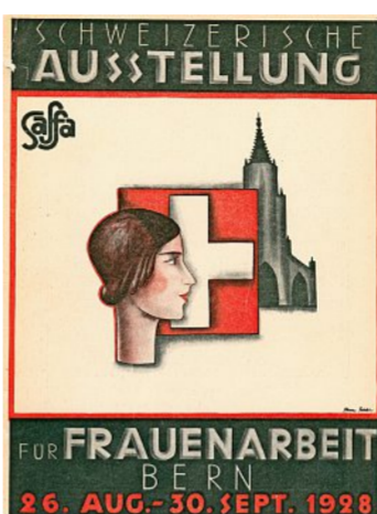
Die Saffa war eine grosse «Schau des Wesens und Schaffens der Frau».

Die Ansicht, dass sich das Politisieren für die Frau nicht gehöre und dass ihr wahres Betätigungsfeld an einem anderen Ort liege, war noch immer weit