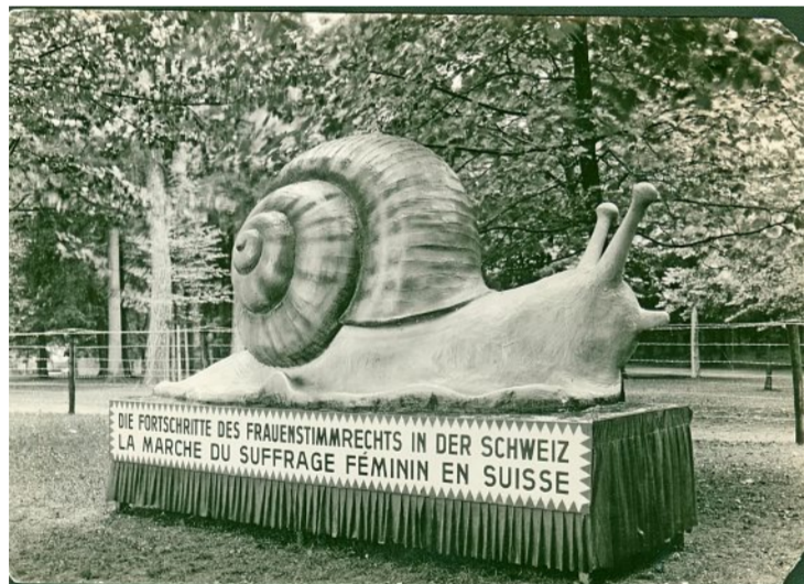
Nach dem Umzug war die riesige Schnecke an der Ausstellung eher abseits parkiert.

Präsidentin des Organisationskomitees der Saffa war Rosa Neuwenschwander (1883–1962), die bereits Pionierarbeit auf dem Gebiet des Berufsbildungswesens geleistet hatte und später verschiedene Sozialwerke initiierte. Sie sagte zur Eröffnung, die Saffa solle für alle Bestrebungen der Schweizer Frau auf den Gebieten der Erziehung, Berufsbildung und Berufsausübung und der Volkswohlfahrt werben. Ihr Zweck sei, dem Schweizervolk «deutlich vor Augen zu führen, welche Aufgaben die Gegenwart an das weibliche Geschlecht stellt, wie neu, wie gross, wie verantwortungsvoll der Pflichtenkreis der Frau in den letzten Jahrzehnten geworden ist». In einem Rückblick zehn Jahre später strich Neuwenschwander Einigkeit, Verbundenheit und Opferbereitschaft, den «Saffa-Geist» heraus. «Nichts trennte uns, weder Konfession, Partei, Sprache, noch gesellschaftliche Stellung.»