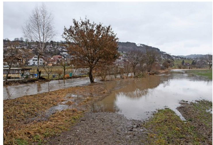
Hochwasser bei der Worble in Stettlen.