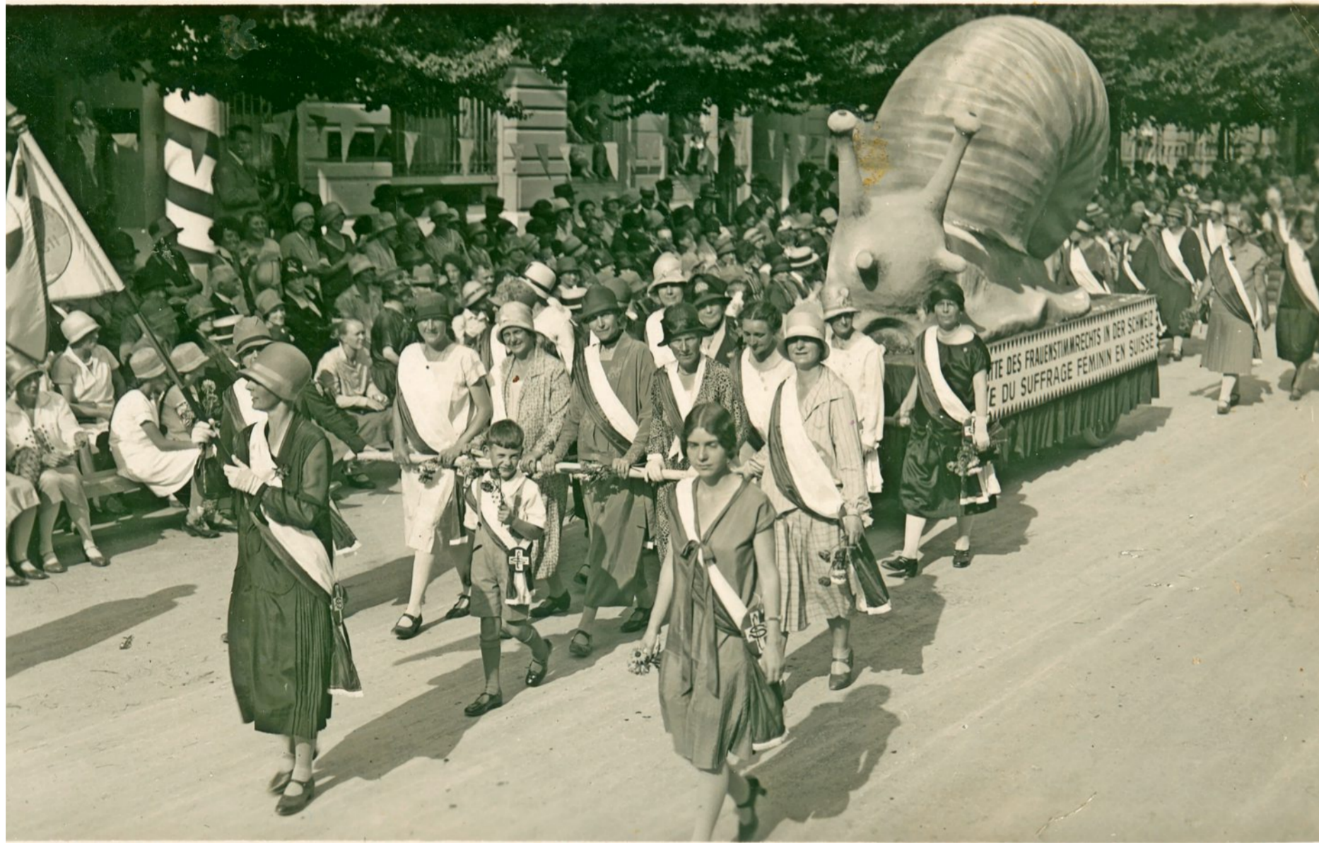
Die Schnecke symbolisierte «die Fortschritte des Frauenstimmrechts in der Schweiz» und zog auch den Spott der Männer auf sich.

Nach dem Ersten Weltkrieg und dem Generalstreik unternahm Frauenrechtlerinnen neue Anläufe für die Gleichstellung. Bei der Planung für die Schweizerische Ausstellung für Frauenarbeit (Saffa) in Bern von 1928 sollten die Leistungen der Frauen in Familie, Beruf, Wissenschaft und Kunst thematisiert werden. Eine grosse «Schau des